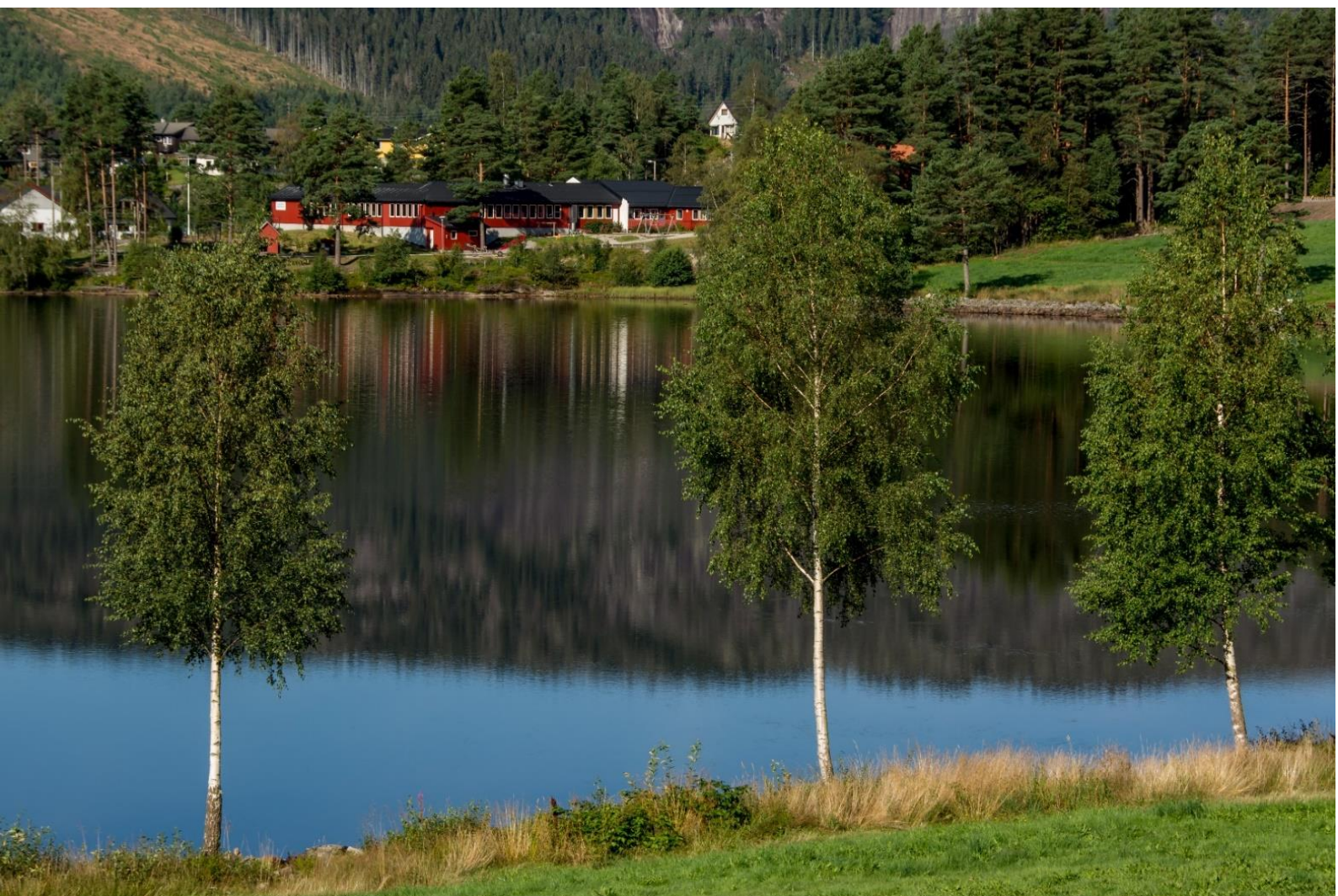
BYGLANDSFJORD OPPVEKSTSENTER.