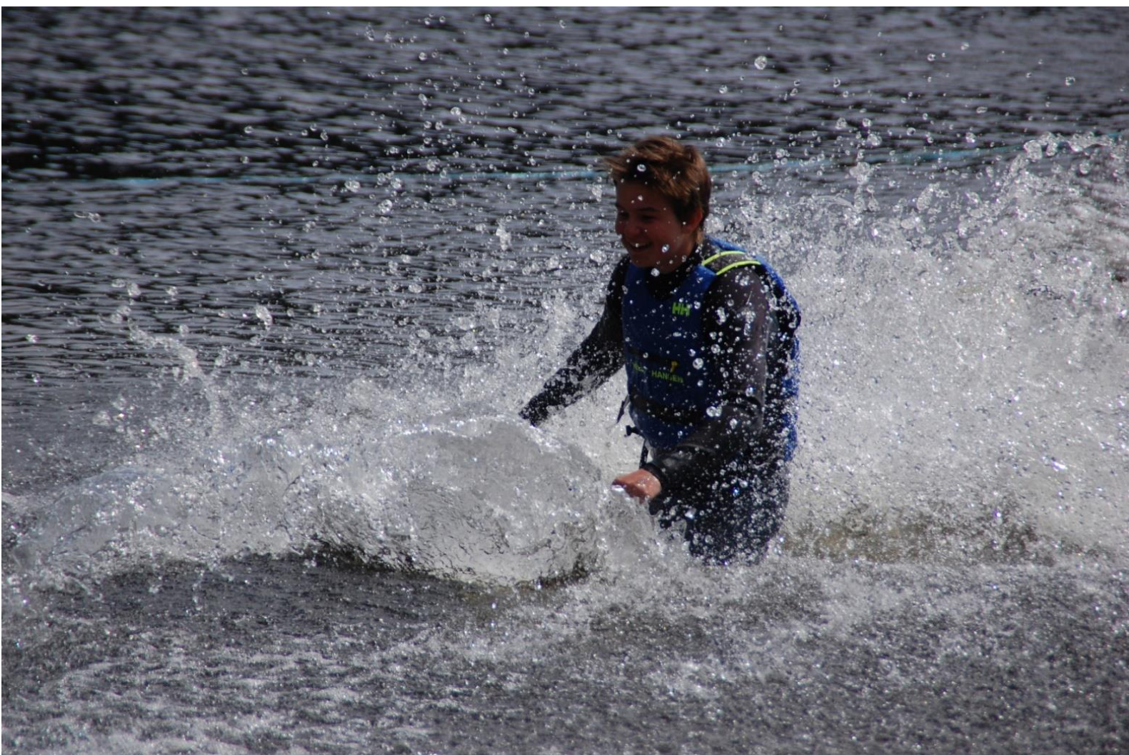
VASSKI PÅ BYGLANDSFJORDEN.