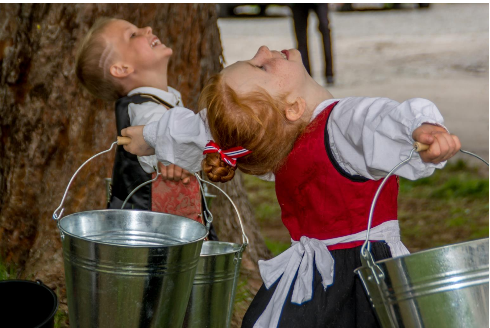
17. MAI PÅ LANDESKOGEN. FOTO: KATHE MERETE KJETSÅ