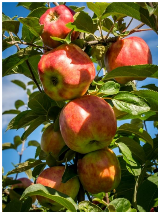
EPLER PÅ LONGERAK.

Bygland har ein sterk entreprenørskapskultur med gode vilkår for vekstkraftige gründerbedrifter i kommunen. Næringsliv og gründerar har tett og god dialog med administrasjonen i kommunen.