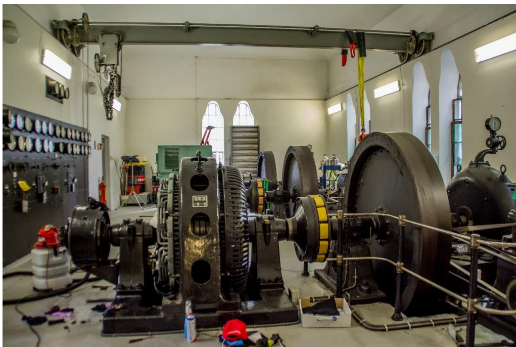
LONGERAK KRAFTSTASJON.

Distriktsvenlege og desentraliserte tilbod om høgare utdanning har skapt gode føresetnadar for kompetanseutvikling, også for dei som ikkje bur sentralt.