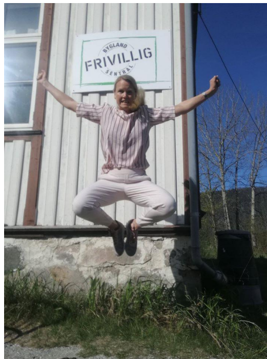
FRIVILLIG GLEDE.

Ein variert og attraktiv bustadmarknad er ein føresetnad for at innbyggjarane vil bli verande gjennom dei ulike livsfasane. Det krev tilrettelegging frå kommunen og vilje til å satse innan næringslivet.