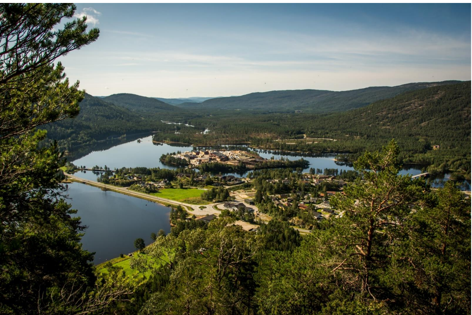
BYGLANDSFJORD. FOTO: KATHE MERETE KJETSÅ