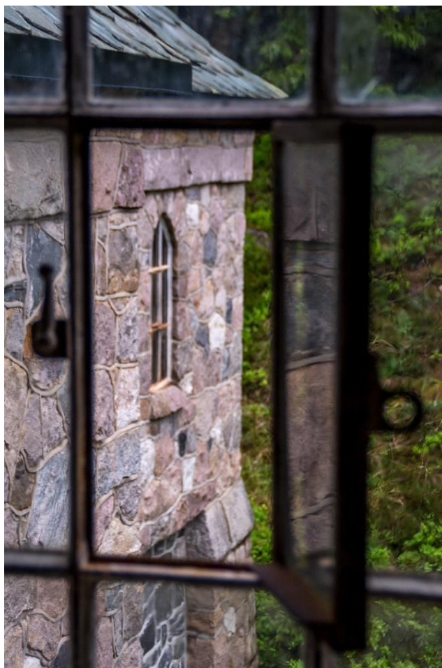
LONGERAK KRAFTSTASJON.

Kommunen skal medverke til å utvikle lokalsamfunnet og gjere det attraktivt å leve og bu her, mellom anna gjennom god planlegging.