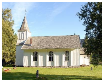
Austad kyrkje.