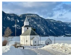
Sandnes kyrkje, Åraksbø.

For nokre år sia overtok kyrkjevevja sjølv rekneskapsføringa som kommunen tidlegare hadde hatt, og dette tilførte fellesrådet kr. 50.000,- ekstra per år. Alt som dette har gjeve av meirinntekter og besparingar, har gått rett inn i vedlikehald av kyrkjene, og dei siste 15 år er det gjennomført