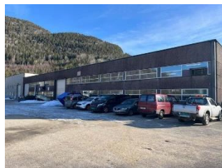
Nesodden Industribygg.

Interessentar vert bede om å sende ein søknad og kan bruke vedlagte forretningsplan som mal. Interessentane må og opplyse i søknaden om prisen dei vil betale for aksjane. Interessentar står fritt til å take bort dei delane av forretningsplanen som ikkje er relevante. Bedrifter som søker må kunne vise til solid finansiell berevne og ha ein plan på korleis dei skal