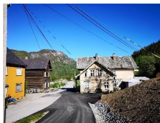
Ose sentrum.