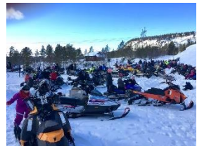
Friluftsgudsteneste ved Hovatn