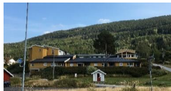
Bilete: Byglandsheimen