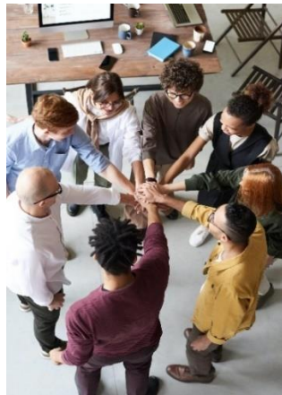
Bilete: Arbeidsplass.