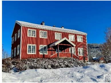
Bilete: Gamle heradshus på Bygland.

Kommunen ser føre seg at dette kan vere eit interessant objekt for private aktørar som ønskjer å skape ny aktivitet Bygland.