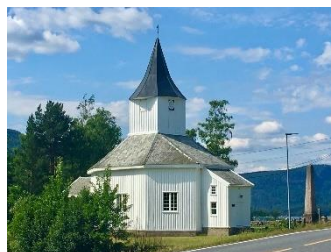
Øvst: Sandnes kyrkje, Åraksbø; i midten: ved Hovatn; nedst: Årdal kyrkje, Grendi. Alle av S. Hegenscheidt