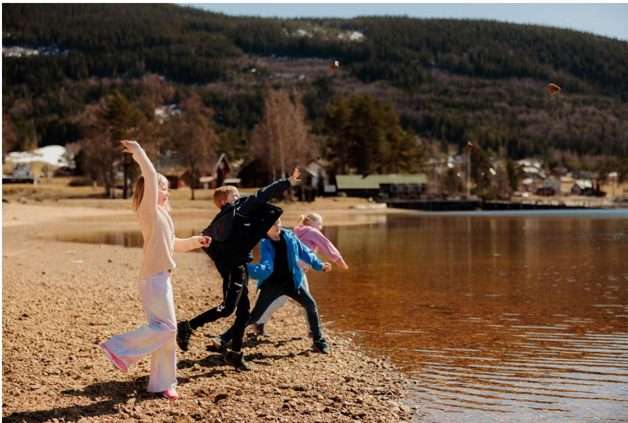
KRAFT OG RETNING