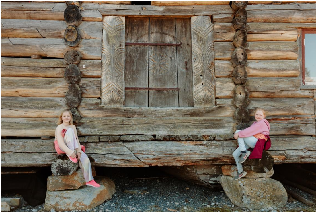
FORTID OG FRAMTID

Kommunen sin økonomi og evne til å løyse oppgåver i samspel med lokalsamfunnet, nabokommunar og mynde er ein viktig del av ei berekraftig utvikling for Bygland. Som grunnlag for ein politisk debatt om kommunen sine satsingsområde i samfunnsdelen, er det laga ei kortfatta samanstilling og situasjonsbeskriving av viktige utviklingstrekk for Byglandssamfunnet. Samanstillinga er basert på kommunen sitt kunnskapsgrunnlag. Det kan være ulike syn på kva som er viktige utviklingstrekk. Innspel frå befolkning, næringsliv, organisasjonar og andre mynde skal bidra til å gi eit godt bilete. Det er derfor dette dokumentet blir lagt ut til høyring og offentlig ettersyn.