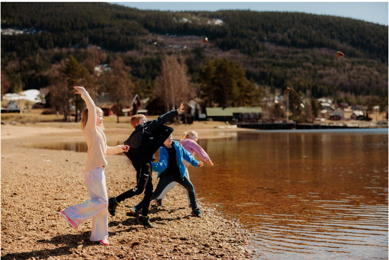
KRAFT OG RETNING