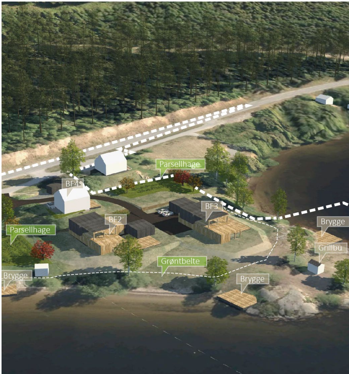
Figur 9 Illustrasjon av planforslaget

Planen regulerer to eksisterende boliger og to nye boliger. Planen legger også til rette for etablering av brygger til tomtene som ligger langs fjorden. Tomtene er store. Dette legger til rette for at de gule områdene får store grønne areal også etter at bebyggelsen er etablert. Samtidig regulerer planen store grønne areal. Langs fjorden er det lagt inn grøntområde for å sikre at landskapet beholder naturpreget. I tillegg er det regulert to arealer for parsellhage, som skal sikre mulighet for fremtidig dyrking av grønnsaker og frukter.