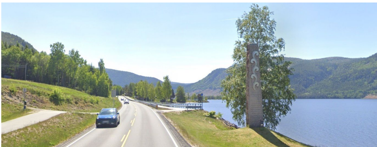
Figur 15 Utsnitt fra Google Maps. Fjernvirkning fra Rv.9, sett mot sør. Eksisterende situasjon.