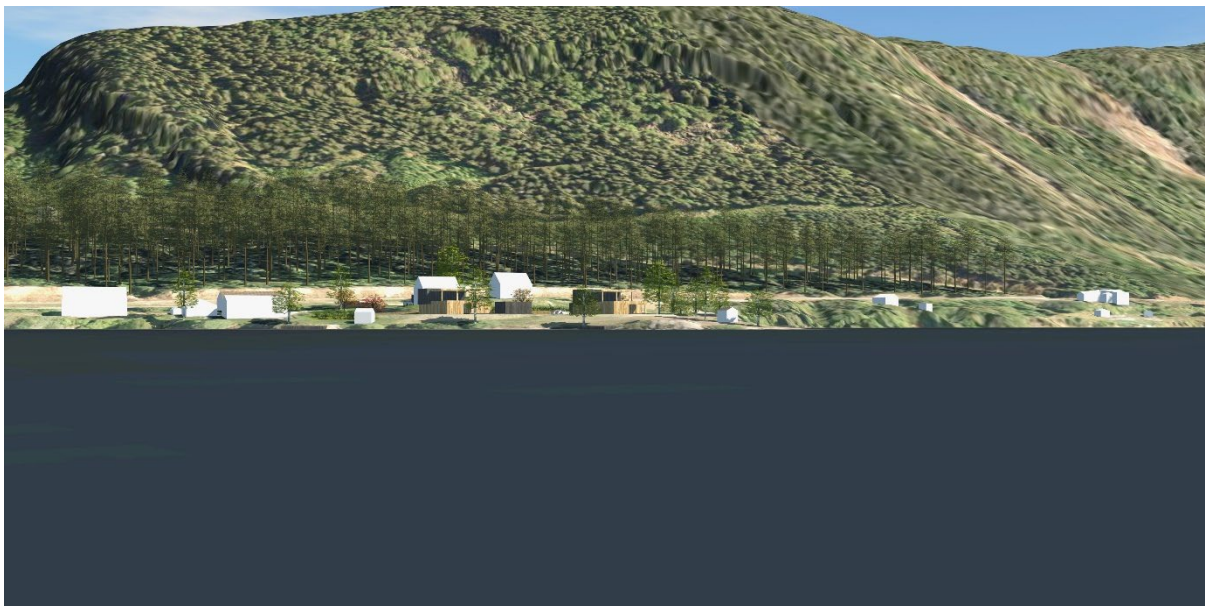
Figur 14 Utsnitt av 3D-modell. Fjernvirkning fra Byglandsfjorden, sett mot øst