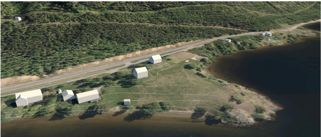
Figur 5 3D-modell av området med flyfoto og koter

Området oppleves forholdsvis flatt, men har en høydeforskjell på ca. 9m fra normalvannstanden i Byglandsfjorden til høyeste punkt ved riksvegen. Strandsonen består av et belte med grøntareal som ikke er opparbeidet. Her er det strender i nord og i sør, og berg med skrin vegetasjon ytterst på neset. Mellom dette naturlige grøntbeltet og jordet, er det flere store trær. I midten av området er det et jorde på 4-5 mål. Jordet henger til en viss grad sammen med en hage på tomte i nord. Boligene ligger mellom jordet i vest og sykkelstien og riksvegen i øst. Her er det større variasjoner i høyder, og en del trær mellom byggene.