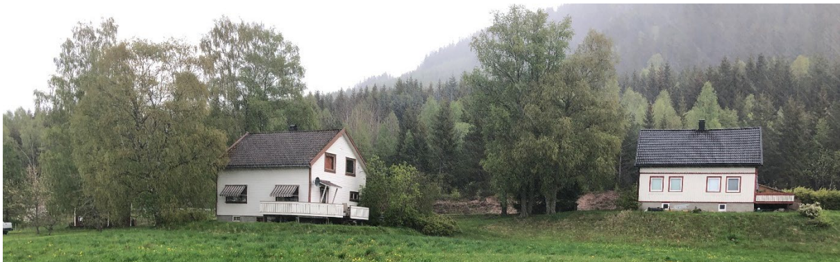
Figur 3 Eksisterende bolig i sør. Boligen til høyre ligger utenfor plangrensen

Det er etablert en brygge innenfor planområdet.