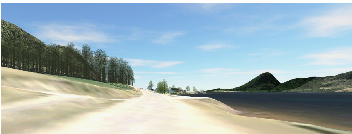
Figur 16 Utsnitt fra 3D-modell. Fjernvirkning fra Rv.9, sett mot sør. Planforslaget. Illustrasjonen viser mindre vegetasjon og omkringliggende terreng enn faktisk situasjon.