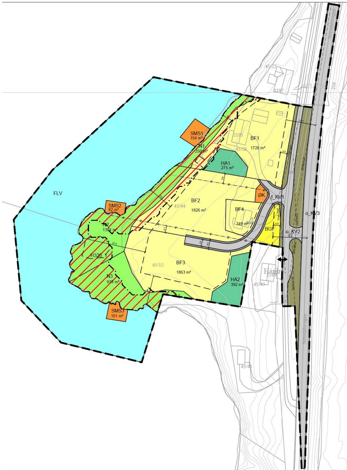
Figur 10 Utsnitt av plankartet