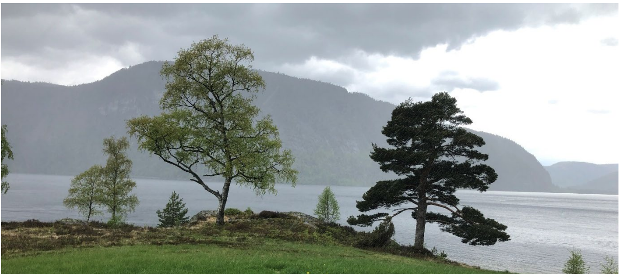
Figur 6 Foto av neset, sett mot vest/ nord-vest