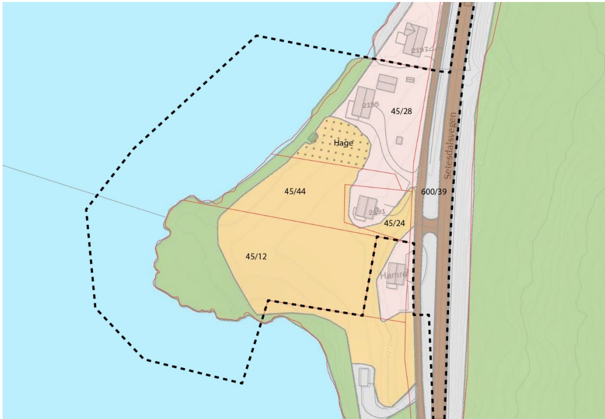
Figur 7 Illustrasjon – AR5 med plangrense

I gårdskart er det angitt 4,9daa med fulldyrka jord (AR5), hvorav 0,6daa er i bruk som hage.