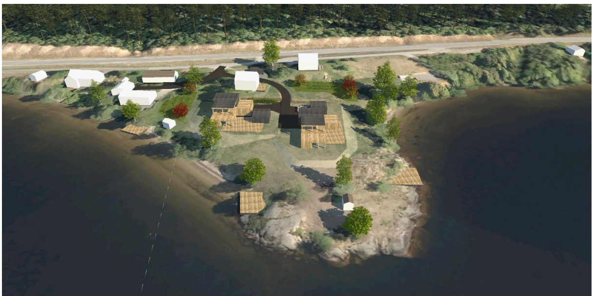
Figur 12 Utsnitt av 3D-modell. Planområdet sett fra vest.

BF2 og BF3 er de nye boenhetene i planen. De tillates etablert både med saltak og pulttak/ flatt tak. Tomtene ligger med svært gode sol- og utsiktsforhold, og tomtestørrelsene er gode. Begge tomtene får brygger. Sammen med nærhet til sentrum gir dette gode boforhold, som gjør det attraktivt å bo på landet.