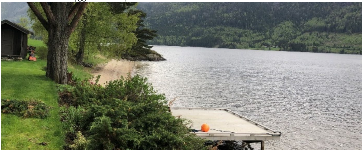
Figur 4 Eksisterende brygge tilhørende boligen i nord

Det er etablert en brygge innenfor planområdet.