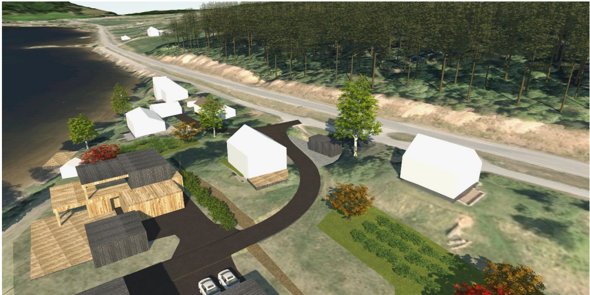
Figur 13 Utsnitt av 3D-modell. BF4 sett fra sør-vest.

Dette er også en eksisterende bolig. Planen åpner opp for etablering av garasje/ carport innenfor BGF. Parsellhagen til BF3 og f_KV1 er med på å sikre gode solforhold på sørsiden av BF4. Fra tomta vil det også bli siktlinjer ned til fjorden.