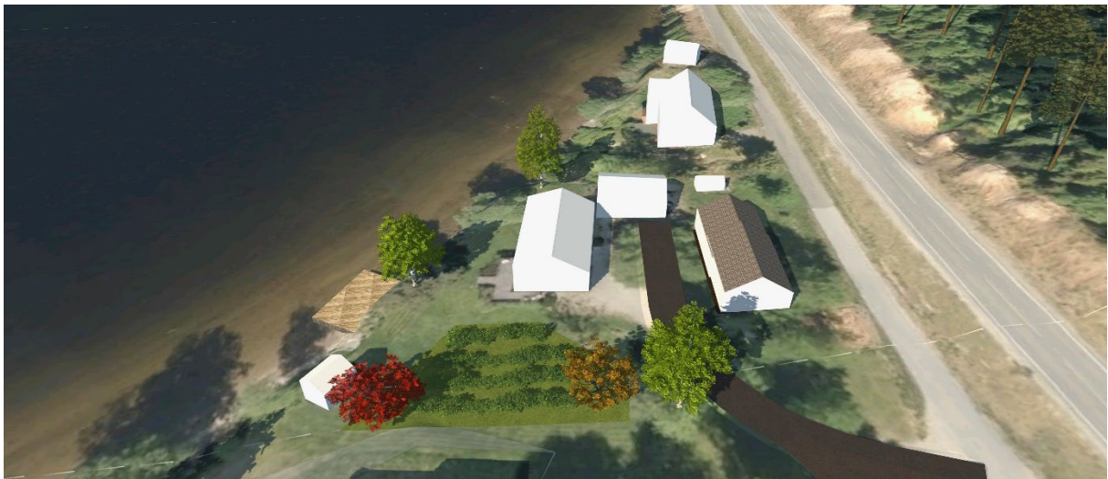
Figur 11 Utsnitt av 3D-modell. BF1 sett fra sør.

BF1 er en av de eksisterende boligene i området. I planen er det lagt til rette for etablering av ny garasje/ verksted i øst, samt en utvidelse av eksisterende garasje i BYA-en. Den ene parsellhagen er også lagt til denne tomta.