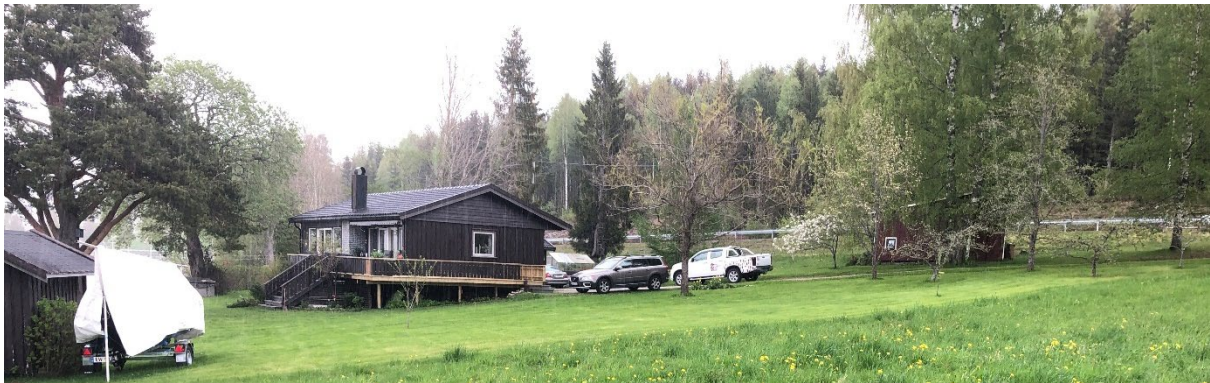
Figur 2 Eksisterende bolig i nord

De eksisterende boligene er dermed eldre boliger med en etasje, eller en etasje pluss loftsetasje. Alle boligene og de fleste sekundærbygningene har saltak. Sammen danner de et idyllisk område med Byglandsfjorden som nærmeste nabo.